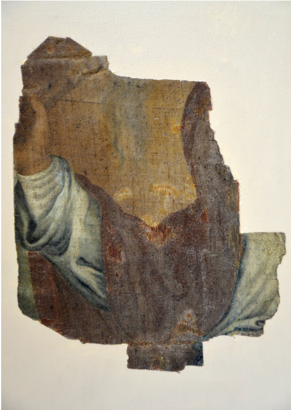
Fragmento del lienzo de Santa Marta “la Vella” que estaba en la capilla de Santa Marta. Es obra de Francisco Vergara el Mayor, de 1740. Vilamuseu

relato evangélico, adoptaba la imagen que hoy todos observamos: de pie, con el hisopo en alto y el acetre con agua bendita, sujetando con una cadena a la tarasca.