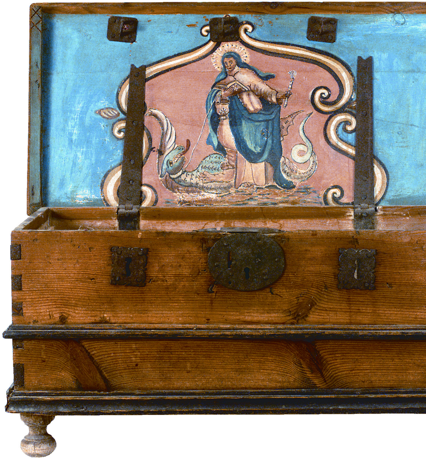
8 Arca de Santa Marta