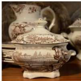
Vajilla de la serie "Vistas de España" de Pickman (hoy, La Cartuja de Sevilla) . 1841-1860

El peso de la decoración recae en las piezas de cerámica y los objetos alrededor de la chimenea, entre los que destacan las lámparas de aceite de bronce.