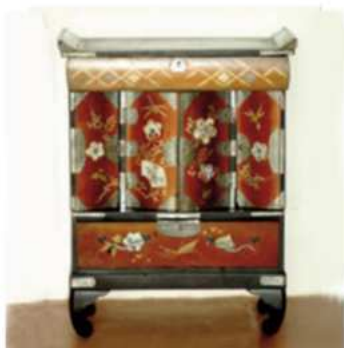
Caja lacada. Fabricada en Japón y exportada a Occidente. Finales del siglo XIX.