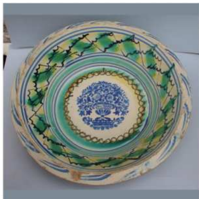
Lebrillos de Triana

Está decorada con cerámica de estilo popular: sobre la chimenea la cerámica es de origen valenciano, en la pared de la derecha encontrarás los coloridos lebrillos de Triana (Sevilla) y en la pared izquierda cerámica de la Bisbal (Girona) y un reloj de ratera fabricado en siglo XIX en la Selva Negra (Alemania).