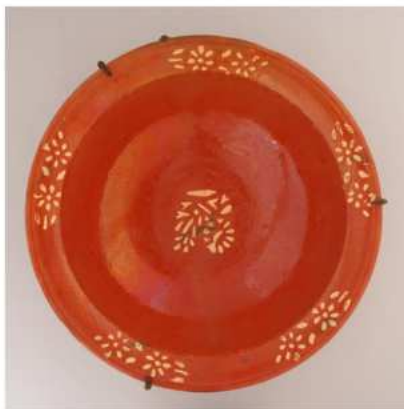
Cerámica de la Bisbal