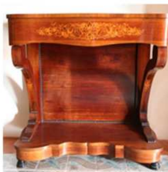
Consola isabelina. Tiene un cajón frontal y otro secreto en la base. 1830s-50s.