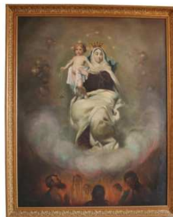
Óleo de la Virgen del Carmen. Es una obra de J. Marced Furió, nacido en la Vila Joiosa. 1919.