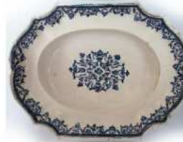
Fuente con decoración de puntilla tipo Berain. Procede de Alcora, Castellón. 1730-1750