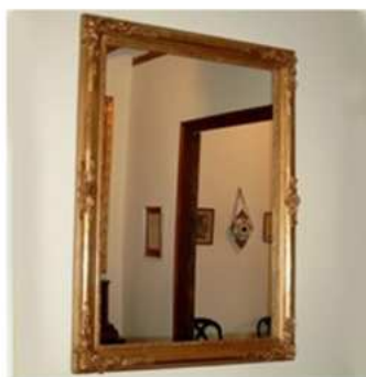
Espejo isabelino. Realizado en madera con pan de oro. Siglo XIX.