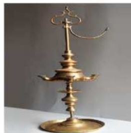
Velón de aceite de bronce dorado de cuatro mechas. Siglo XVIII - XIX