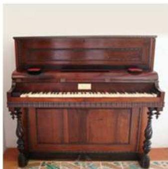
Piano vertical. Realizado en nogal con molduras onduladas. Siglo XIX.