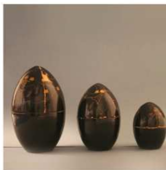
Juego de huevos de madera lacada en negro en la parte exterior y rojo en el interior. Fabricado en Japón. Siglo XIX