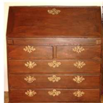
Buró del siglo XVIII