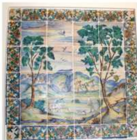
Panel de cerámica con escenas de caza y recolección de estilo barroco. Siglo XVIII.