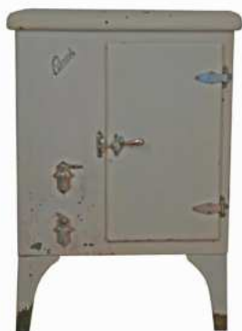
Frigorífico Romi de metal lacado en blanco con motor en el lado izquierdo. Lleva dos grifos, uno para desaguar el bloque de hielo y otro para proporcionar agua fresca. Años 40-50 del siglo XX