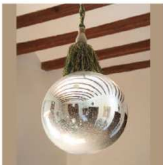
Bola de espejo decorativa. Aparece mencionada en una carta de los años 70 del siglo XIX.