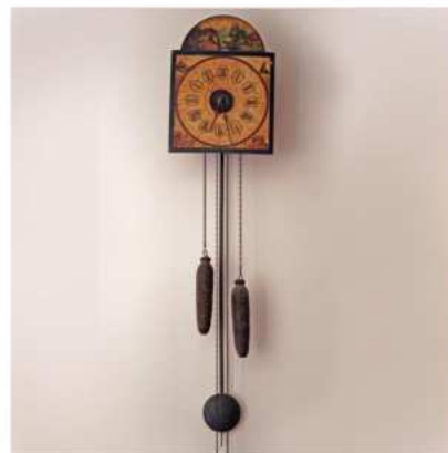
Reloj de ratera