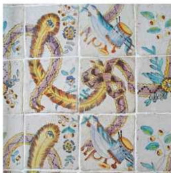
Suelo de azulejos del salón, de estilo rococó. Siglo XVIII.