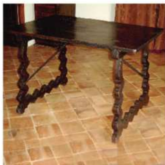
Mesa de fiadores. Es uno de los muebles más antiguos de la casa. Finales siglo XVII o siglo XVIII.

El despacho era un ámbito masculino y con elementos de carácter científico como el globo terráqueo, el barómetro o el reloj de arena.