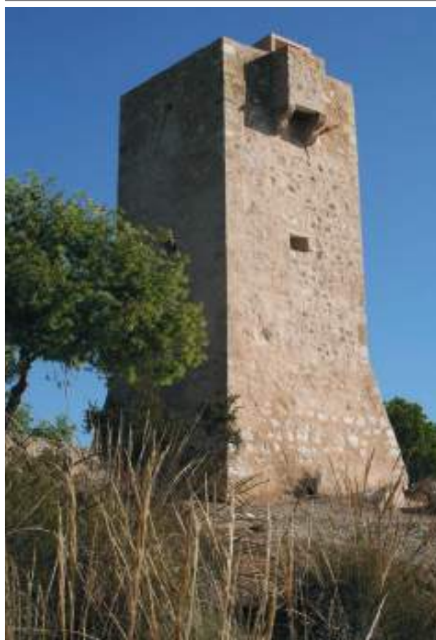
Torre de l'Aguiló.

Per a impulsar el cors valencià, el rei va emetre en