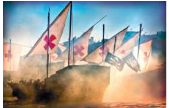
Alijo de Contrabandistes i Pirates Corsaris 2010. Autor: Ginés Lloret.

Aquest acte, gràcies al seu horari vespertí, s'ha convertit en el «bateig de mar» dels xiquets i xiquetes que participen en la festa. La majoria espera la vesprada amb impaciència perquè es converteixen en autèntics guerrers que lluiten en la riba per a defensar la costa, un espectacle que va calant de generació en generació.