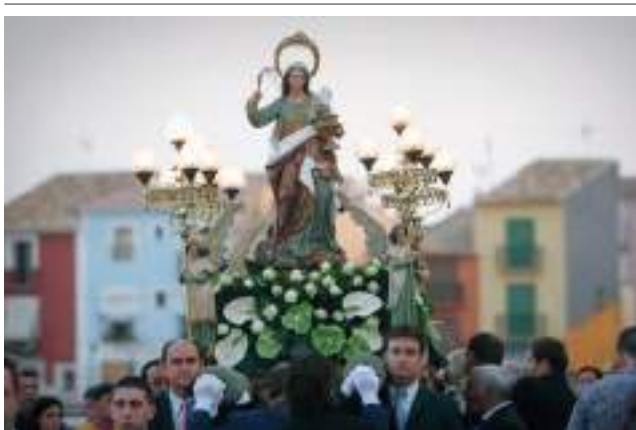
Santa Marta en processó.