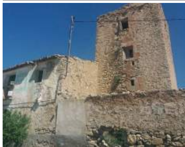
Estat actual de la torre d'Horta de Dalt, en l'Era de Soler.

El partit de Vilajoiosa tenia tres castells i sis torres: torres de la Galera i del Cap Negret i el Castell d'Altea a Altea; la torre de la Bombarda, hui a l'Alfàs del Pi (dues talaies fan la descoberta de les penyes de l'Albir, el nom del qual significa «penyes de l'albirament», en relació amb aquest sistema de guaita); torre de les Escaletes, a Benidorm; un talaia feia la descoberta en la cova de Moncàxer (hui del Barber, a Benidorm); el Castell de Benidorm; la torre de l'Aguiló; el Castell de Vilajoiosa i la torre del Xarco o de Giraley.