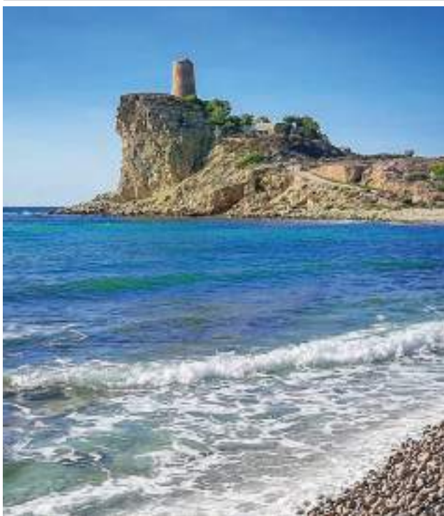
La torre del Xarco. Autora: M a Dolores Nogueroles.

Van nàixer després de 1560. Van ser molt efectives per a evitar desembarcaments i molt àgils. Es van formar cinc companyies allotjades a València, Moncofa, Canet, Oliva i Vilajoiosa. El seu manteniment corria per compte de la Generalitat. Estaven formades per veïns d'aquestes viles i dels seus voltants. Eren la primera força que es mobilitzava i avaluava la situació mentre