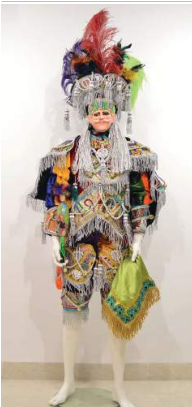
Vestit de moro utilitzat a les danses de Moros i Cristians de Chichicastenango (Guatemala).

incursió d'un cavaller austríac en un campament turc al segle XV.