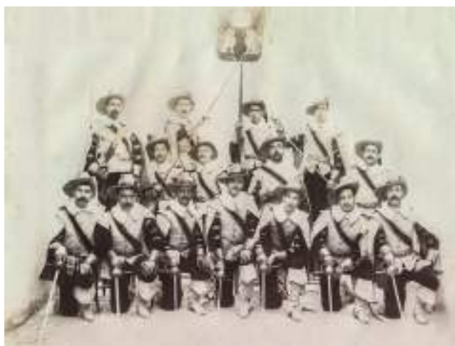
Grup de mosqueters. 1901

Al llarg de la història dels Moros i Cristians de la Vila Joiosa no sempre han participat les mateixes companyies. Hi ha algunes que van tindre un pas efímer, com ara els Mosqueters (1901-1947), els Alabarders (1901-1952), els Moros del Rei (1901), els Asturians (1926) i els Moros Comerciants (1958).