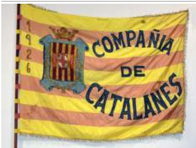
Bandera de la Companyia Catalans, 1926.