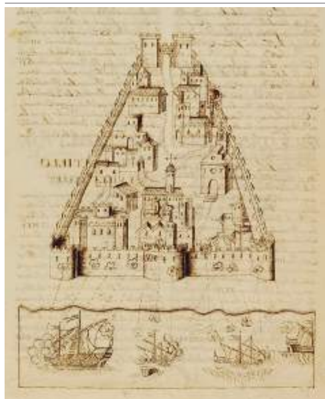
Dibuix del «Llibre tercer de la Chronyca de la inclita i coronada ciutat i Reyno de València» de Rafael Martí de Viciano (1564, pàg. 361). Biblioteca Valenciana Nicolau Primitiu / Biblioteca Valenciana Digital (*BIVALDI), signatura XVI/46. Representa, sens dubte, l'atac de 1538, que estava en l'imaginari col·lectiu de la població valenciana com una gesta assenyalada.

determinació de saquejar la Vila, però es va trobar amb una flotilla de vaixells mercants i de pesca, els va prendre i se'n va desentendre temporalment. En els vaixells capturats van carregar mil dos-cents moriscos fugitius i els van dur a Alger, però la flota barbaresca va quedar a la vista de Calp, encara que tot indicava que pretenia caure sobre la Vila, com efectivament va ocórrer l'alba del 29 de juliol.