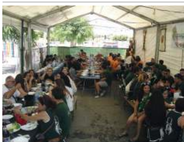
Quarter fester durant el menjar. Companyia Almogàvers

La camaraderia, la convivència i la fraternitat són valors inherents a la festa vilera i és en els quarters on aconseguen la seua màxima dimensió. De fet, és