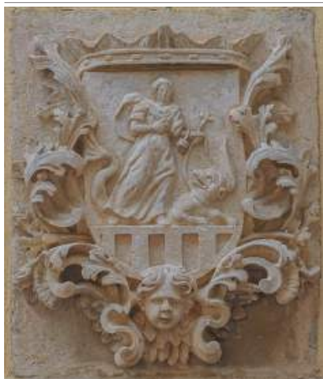
Escut sobre la porta de l'Ajuntament de la Vila Joiosa. 1703