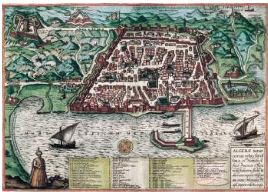
Mapa d'Alger, segons Braun and Hogenberg, 1575: Civitates Orbis Terrarum, vol. II, p. 59 (basat en un gravat de 1541 d'Antonio Salamanca).

A Hayreddin el va succeir en 1533 com a califa d'Alger el renegat sard Hassan Agha fins a 1545, i a aquest el fill de Hayreddin, Hassan Pasha, fins a 1572. Tot aqueix temps va durar la supremacia turca de la Mediterrània, fins a la