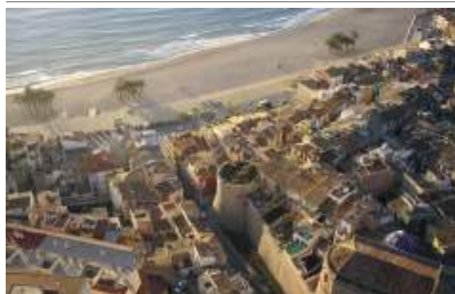
Muralla i església fortalesa de la Vila, amb la mar al fons.