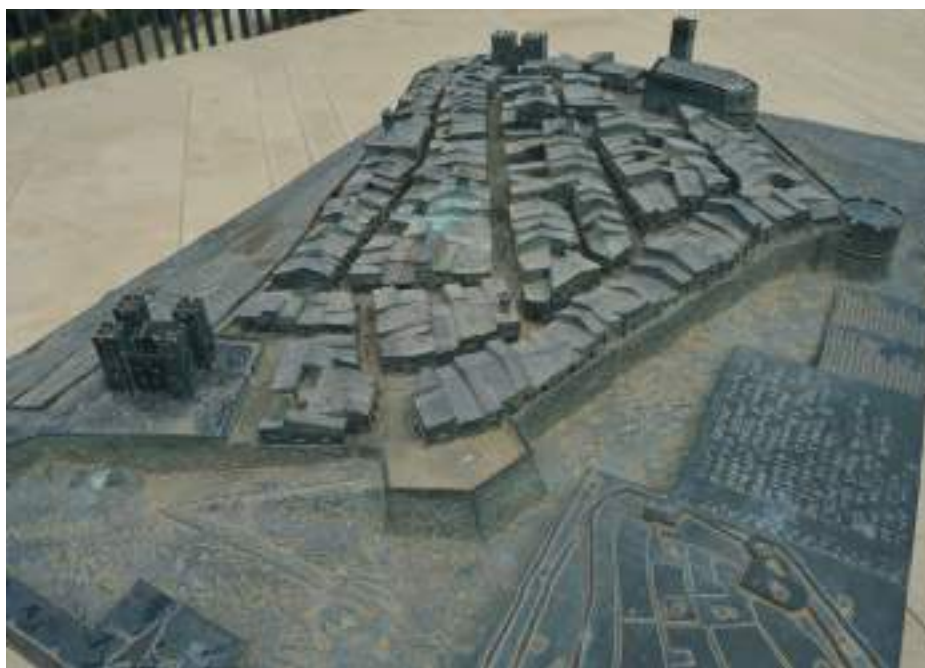
Maqueta de la Vila al segle XVII, Parc cultural del Castell. Es veu el baluard poligonal de la muralla de la Mar, que defensava el Portalet.

L'església de l'Assumpció de la Vila és un exemple d'església fortificada de la costa, al costat de Vinaròs, Benicarló, Xàbia o Monfort, entre d'altres. Són una de les manifestacions més interessants de les fortificacions