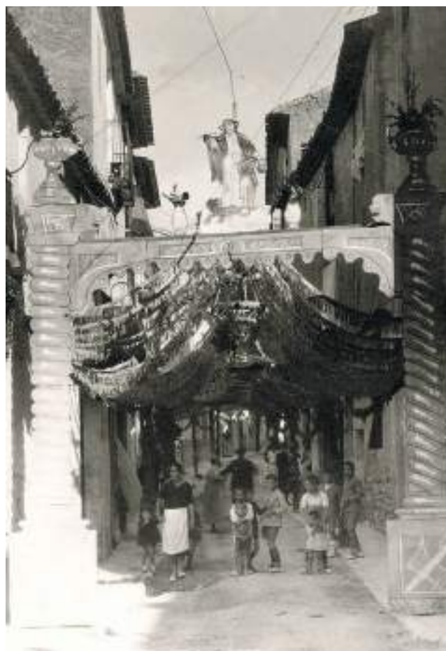
Carrer Doctor Álvaro Esquerdo, popularment Carrer Llimons , engalanat i amb la imatge de Santa Marta sobre un arc d'entrada.

Aquesta tradició es va mantindre durant algunes dècades, però als anys 70-80 molts veïns van abandonar el barri antic per a viure en altres zones noves de la ciutat i aquesta tradició es va anar perdent.