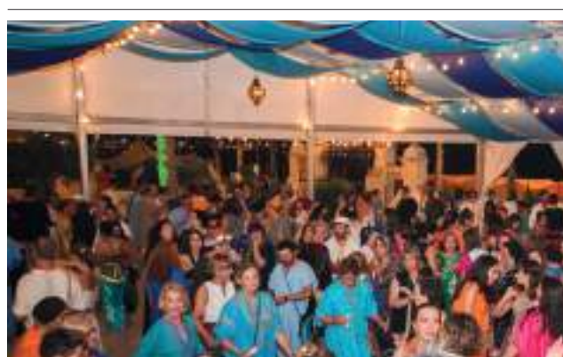
Quarter fester. Companyia Beduïns. Festes 2018.

característic de la Vila Joiosa, encara que no és un acte oficial, la visita als quarters. De migdia, les companyies ixen de cercavila amb la seua banda de música i visiten altres quarters per a compartir música, gastronomia i amistat.