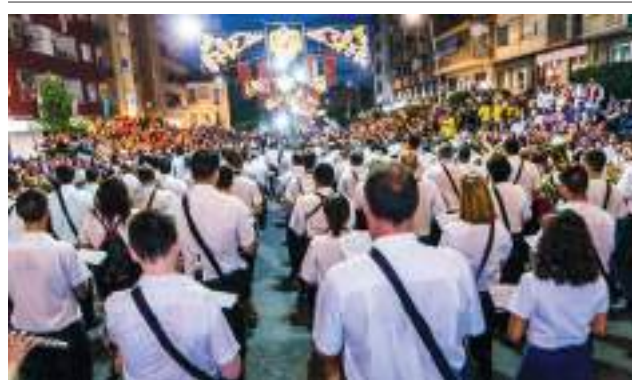
Banda de música en el sector fester durant la desfilada Cristiana de 2019..

En la història de la música festera composta expressament per a la Vila Joiosa, n'hi ha molts títols. Especialment en els últims anys s'han compost moltíssimes marxes i pasdobles dedicats als diferents càrrecs festers.