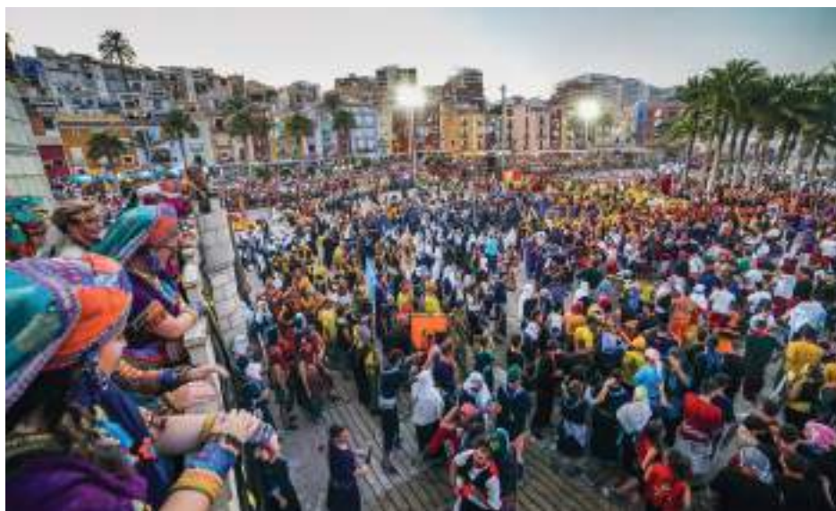
Las 22 compañías festeras durante 'la Reconquista' que té lloc la vesprada del 28 de juliol. Autor: Paco Lloret.

El capità/ana es tria cada any i és la representant i màxim càrrec fester de la companyia en els actes oficials. Es distingeix per dur una indumentària diferent de la resta dels membres de la companyia i en la desfilada participa precedit d'ostentació i escorta.