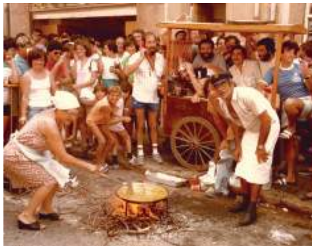
Concurs de paelles en els anys 80.

Sens dubte, la paella és un dels plats més típics de la nostra terra i, a més, està lligat a dies festius, als diumenges, a les reunions d'amics en les casetes de camp. Potser aquest és el motiu pel qual hi ha molta gent que sap els «secrets» de la seua elaboració i aquest dia festers i festeres de cada companyia participen en el concurs. Això sí, la tasca no és senzilla perquè