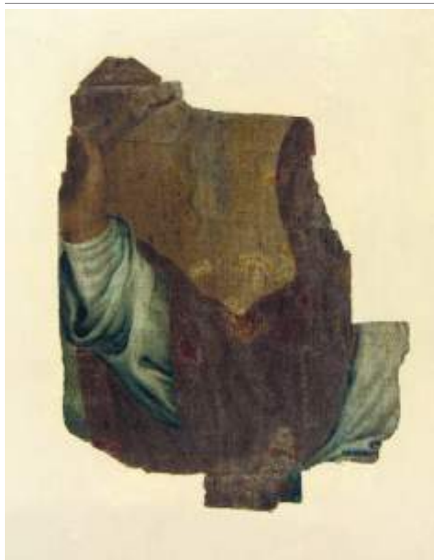
Santa Marta. Oli sobre tela. 1740

«A Santa Marta han vist pujar pel Portalet, per a demanar-li al Senyor