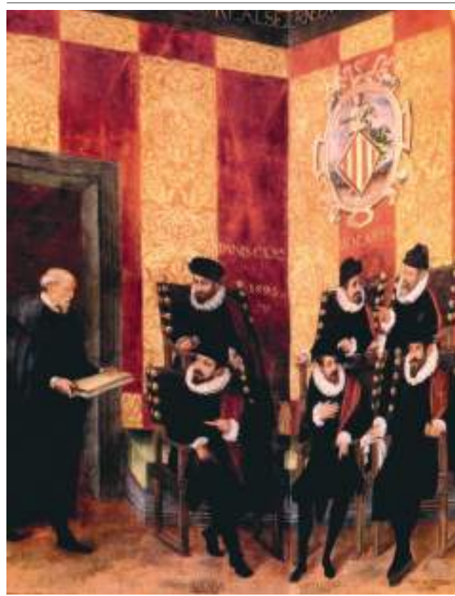
Sessió de les Corts Valencianes de 1593. El representant de la vila reial de «Vilajoyosa» (grafia antiga de Vilajoiosa) apareix a la cantonada inferior al costat d'uns altres del braç reial. Saló de Cortes.

La famosa victòria cristiana en el desembarcament de Vilajoiosa en 1538, el fracàs de cinc anys més tard a la mateixa plaça i el saqueig de Dragut a Cullera en 1550 van encendre totes les alarmes i van tindre molt a veure en l'exigència que els tres braços de les Corts Generals de Montsó de 1552 van fer al rei perquè prenguera decisions de gran importància en aquest tema. Així, van obtindre el compromís de la creació d'una guàrdia i de la construcció de torres que completaren el sistema defensiu costaner, a càrrec de l'impost sobre la seda. L'ordre d'execució la va donar el virrei de València Bernardino de Cárdenas i Pacheco, duc de Maqueda, el 15 d'octubre de 1554.